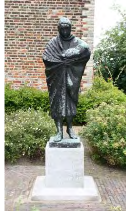
Jan Wolkers, Kruiningen, 1957