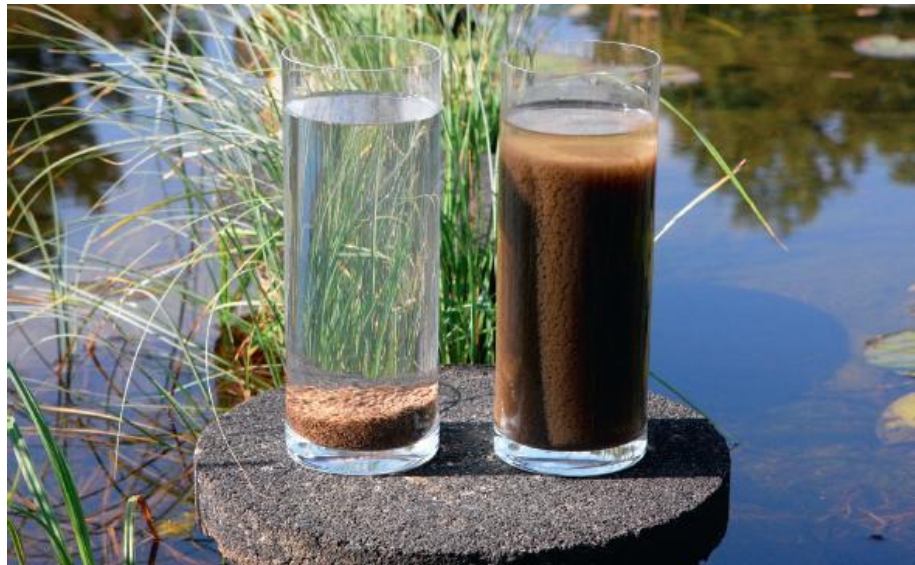
Korrelslib (links) en actiefslib na vijf minuten bezinking.

Nereda® is een innovatieve technologie voor biologische afvalwaterzuivering die gebruikmaakt van de unieke eigenschappen van 'aëroob korrelslib'. Dit aërobe korrelslib staat garant voor kosteneffectieve zuivering in compacte en eenvoudig te bedrijven installaties, die minder energie verbruiken en effluent van zeer hoge kwaliteit leveren.